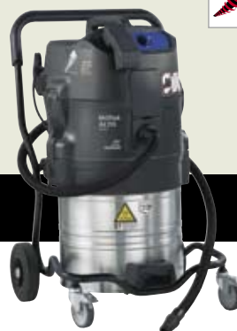
▲ ATTIX 791-2M/B1