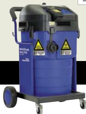
▲ SQ 890-3M/B1