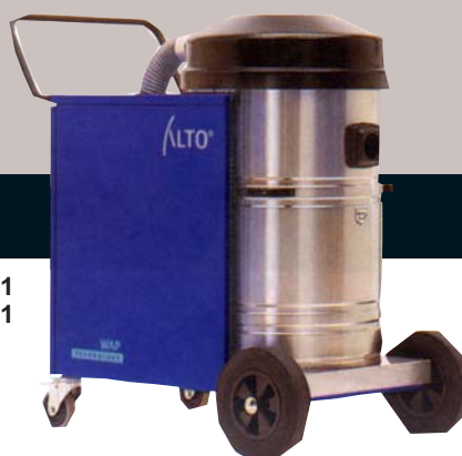
◀ TURBO D/X-B1 ◀ TURBO D-B1

Špičkové sací výkony i při odstraňování výbušných odpadů v průmyslu a v podnikání St1, St2 a St3 v zóně 22 (dříve zóna11) • Pro prach s třídou výbušnosti