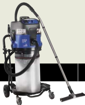
ATTIX 763-2M ED ▲