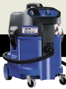
ATTIX 560-2H XC ▲ ATTIX 550-2H