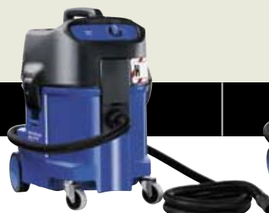
ATTIX 550-0H ▲