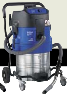
ATTIX 751-0H ▲