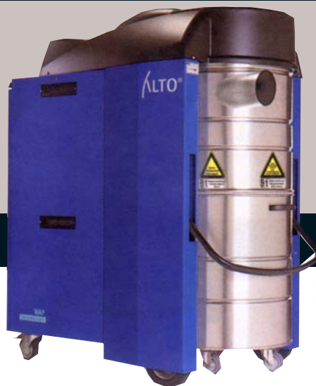
◀ DYNAMICS 840 M/B1 ◀ DYNAMICS 440 M/B1