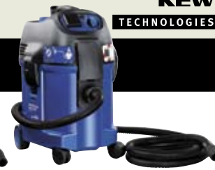
ATTIX 360-2M ▲

XtremeClean Systém automatického čištění filtru