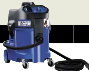
ATTIX 560-2M XC ▲ ATTIX 550-2M