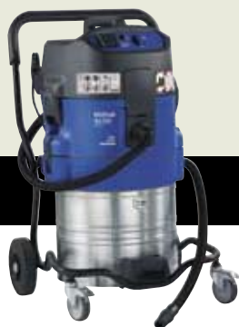
ATTIX 761-2M XC ▲ ATTIX 751-2M