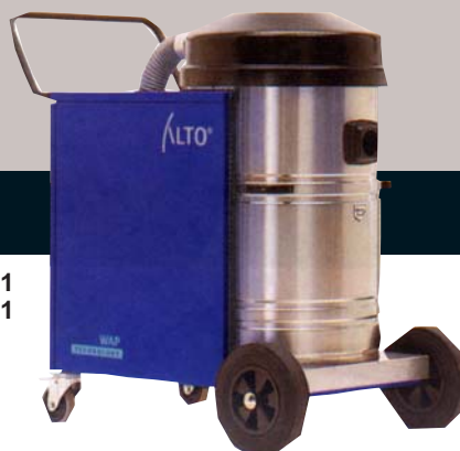
◀ TURBO D/X-B1 ◀ TURBO D-B1

Špičkové sací výkony i při odstraňování výbušných odpadů v průmyslu a v podnikání St1, St2 a St3 v zóně 22 (dříve zóna11) • Pro prach s třídou výbušnosti