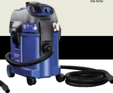
ATTIX 360-2H ▲ ATTIX 360-0H

S těmito vysavači lze vysávat prach tříd L, M, H a azbest (rakovinotvorné, choroboplodné zárodky, prachy s bakteriemi atd.). Dokonce i v této kategorii je dodáván model se systémem čištění filtru XtremeClean. Použití v průmyslu a obchodu s chemikáliemi, plasty, léky, papírem, textilem atd.